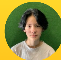
Alex Čermák Autor článku